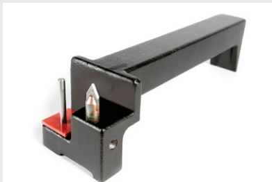
NAGEL-Bohrerschärfer für schnelles Nachschleifen „vor Ort“